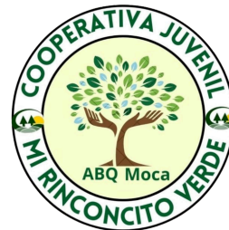
Cooperativa Mi Rinconcito Verde Escuela Adolfo Babilonia

Se les reconoce por ser semilla de un futuro solidario, donde el Cooperativismo juvenil florece como ejemplo de compromiso, trabajo en equipo y responsabilidad social. Su dedicación demuestra que, cuando la juventud se une bajo valores de ayuda mutua y cooperación, se construyen comunidades más justas, conscientes y llenas de esperanza.