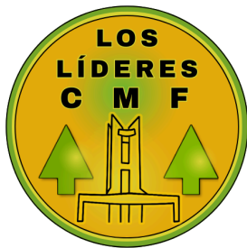
Cooperativa Líderes CMF Escuela Catalina Morales de Flores